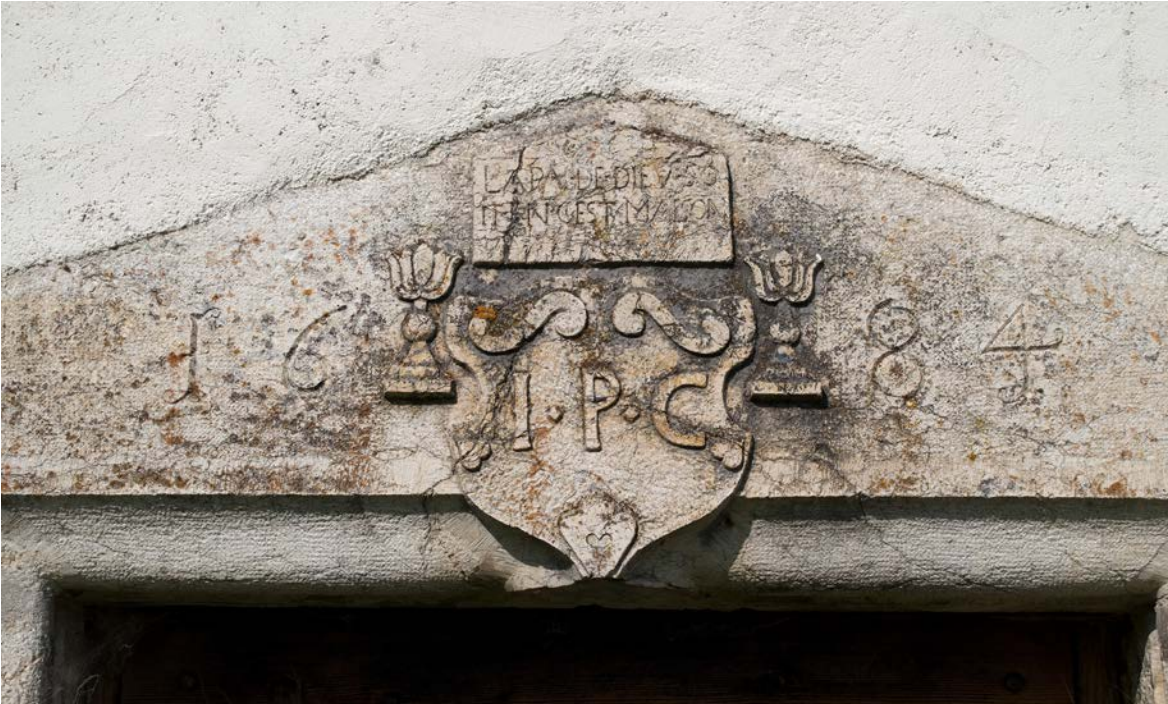
Année de construction dans l'encadrement de la porte d'entrée.

Attention : les photos jointes ne peuvent être utilisés qu'en relation avec la Fondation Vacances au cœur du Patrimoine , avec la mention du photographe Gataric Fotografie et Jacques Bélat .