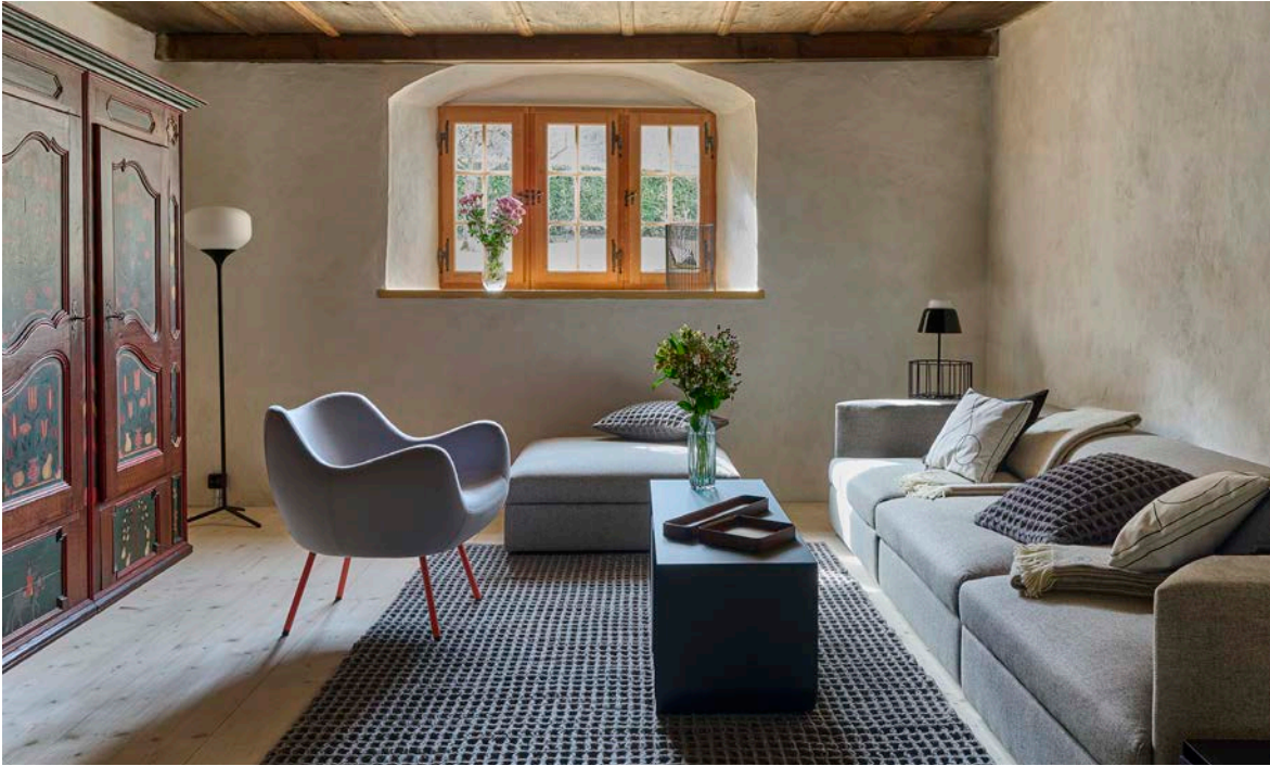
Salon avec armoire de ferme historique.