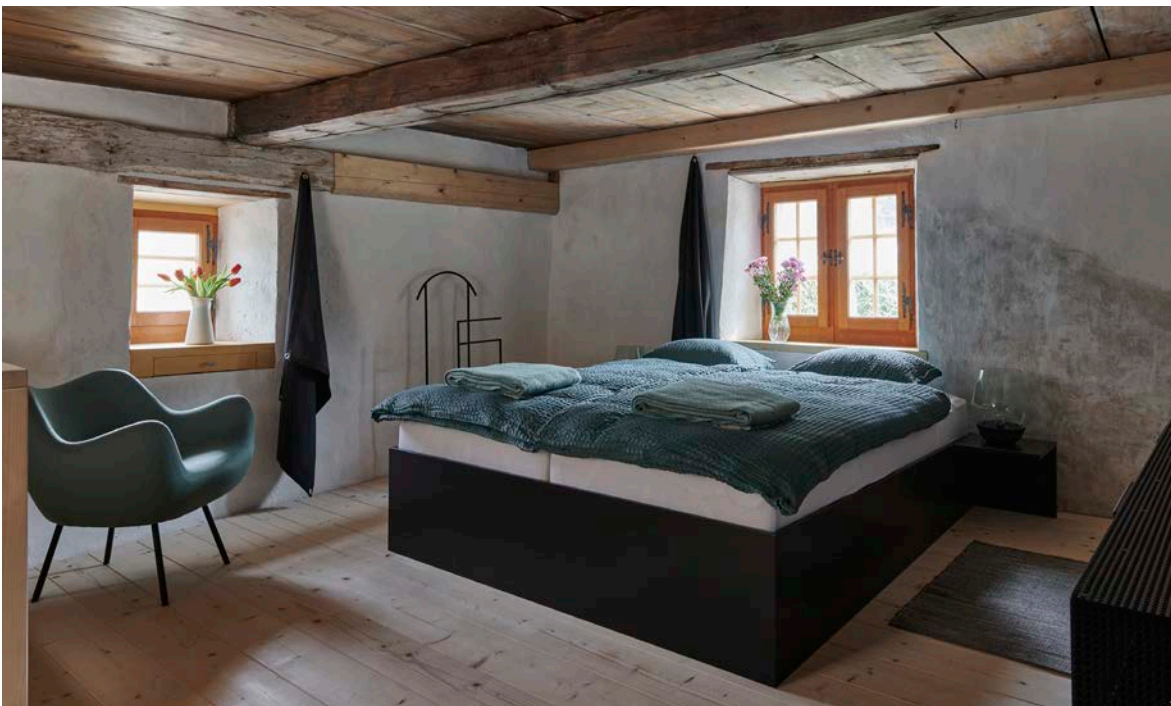
La chambre double supérieure avec vue sur la nature.