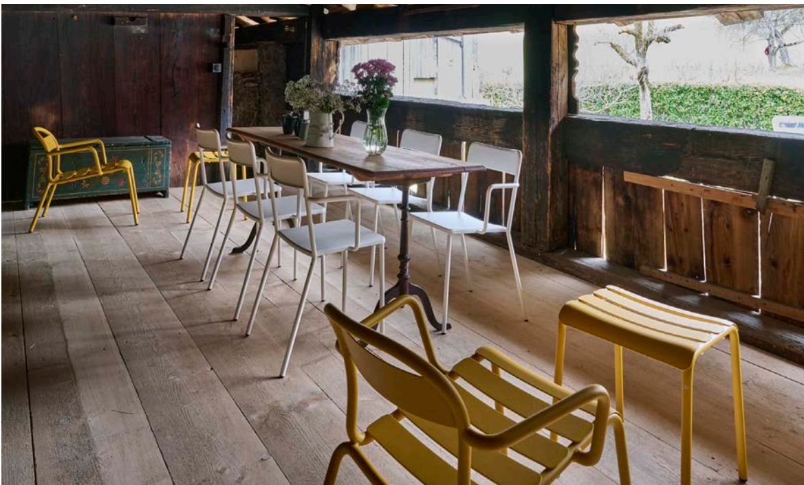
Terrasse couverte agréable sous la tonnelle.