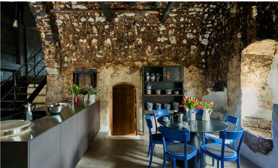
Grande cuisine voûtée avec kitchenette moderne et armoire de cuisine historique.