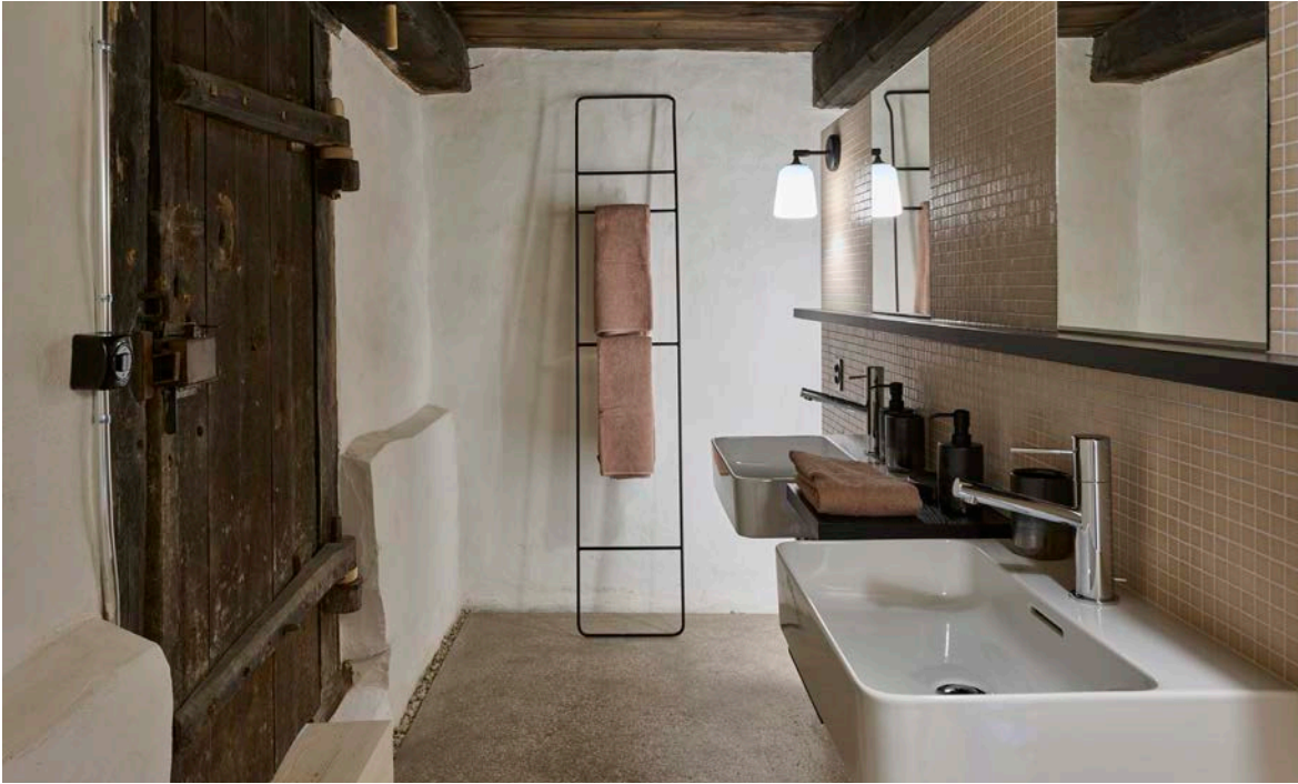
Salle de bain moderne avec porte historique en bois.