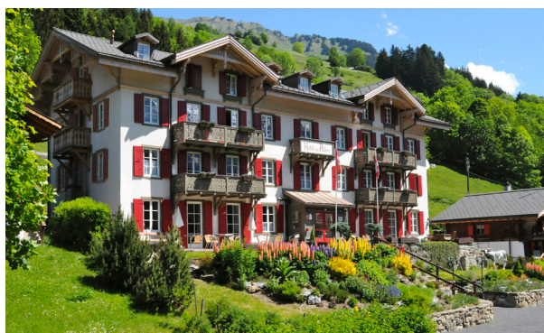
Hotel du Pillon, Les Diablerets (VD), bâtie en 1875