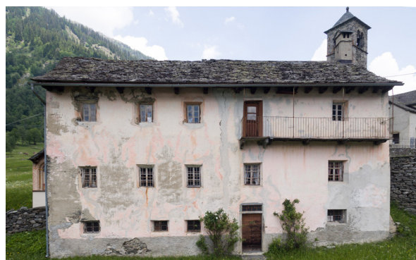
Casa Perrocchiale in Campo (Vallemaggia - TI), bâtie en 1774