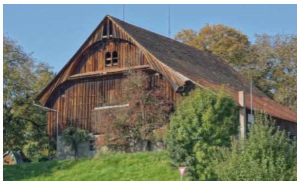
Scheune Musegg in Dietwil (AG), bâtie en 1842