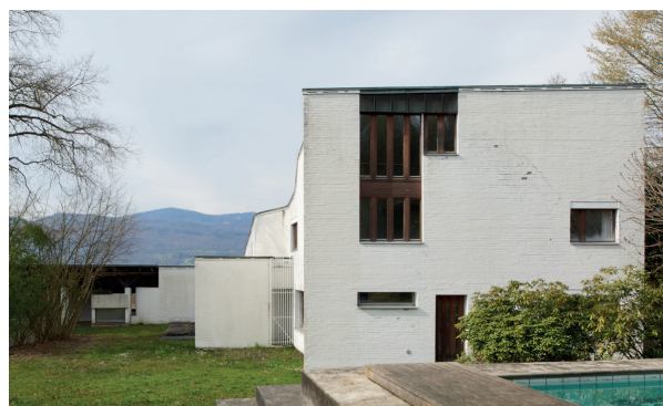
Haus Kissling in Kappel (SO), bâtie en 1960